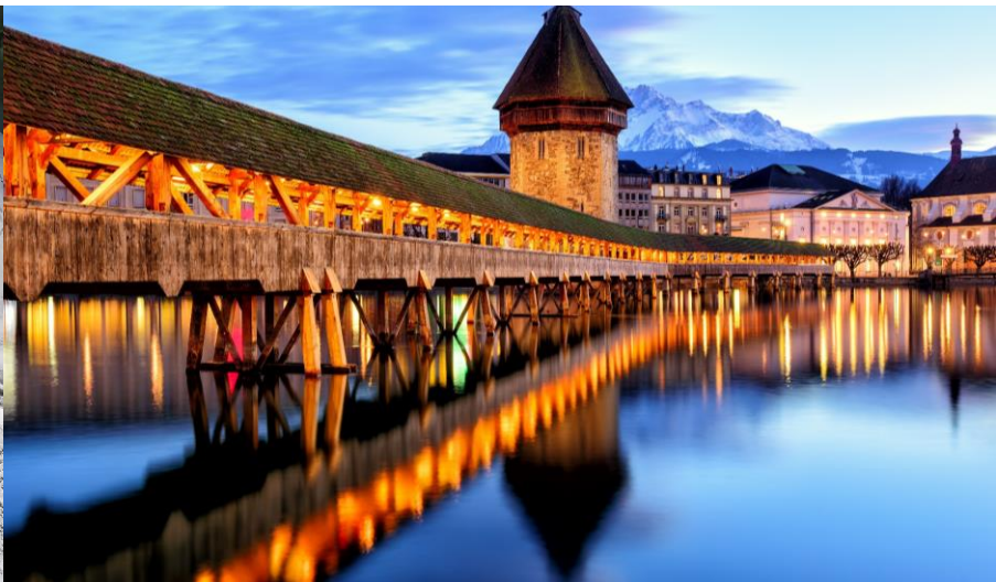
ของชาวสวิตตลอดแนวสะพาน