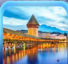
สะพานไมซ์าเปลา