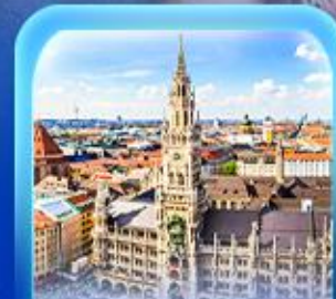
จัตุรัสมาเรียนพลาทซ์

เวียนนา ปราสาทนอยชวาสไตน์ ลูเซิร์น เซอร์แมท ชุก ซูริก